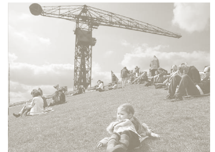
gemene grond Helling X NDSM