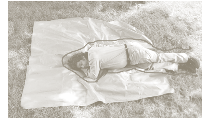
de maat van jouw aandeel in de collectieve plek

Voorstel voor het maken van een collectieve publieke ruimte. Iedere burger krijgt een voucher voor een oppervlakte grond ter grootte van zijn lichaamsomtrek. Deze vouchers worden gezamenlijk geldig op het moment dat hij/zij met nog minimaal 49 anderen voor dezelfde gemeenschappelijke bestemming vindt. Deze bestemming kan alles behalve wonen of werken zijn. Het beheer en onderhoud van de gezamenlijke plek is voor de indieners. Wanneer dit niet of ernstig onvoldoende gebeurt komen de vouchers weer beschikbaar voor anderen.